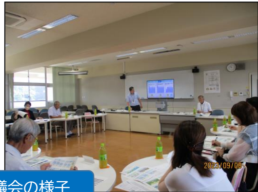
学校運営協議会の様子